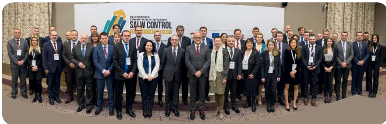
Sastanak na visokom nivou u Podgorici, februar 2018. godine

Zapadni Balkan je bezbedniji region sa uspostavljenim sveobuhvatnim i održivim mehanizmima za identifikovanje, sprečavanje, krivično gonjenje i kontrolu nedozvoljenog posedovanja, zloupotrebe i trgovine vatrenim oružjem, municijom i eksplozivima. Pomenuti mehanizmi u potpunosti su usklađeni sa standardima Evropske unije i drugim međunarodnim standardima.