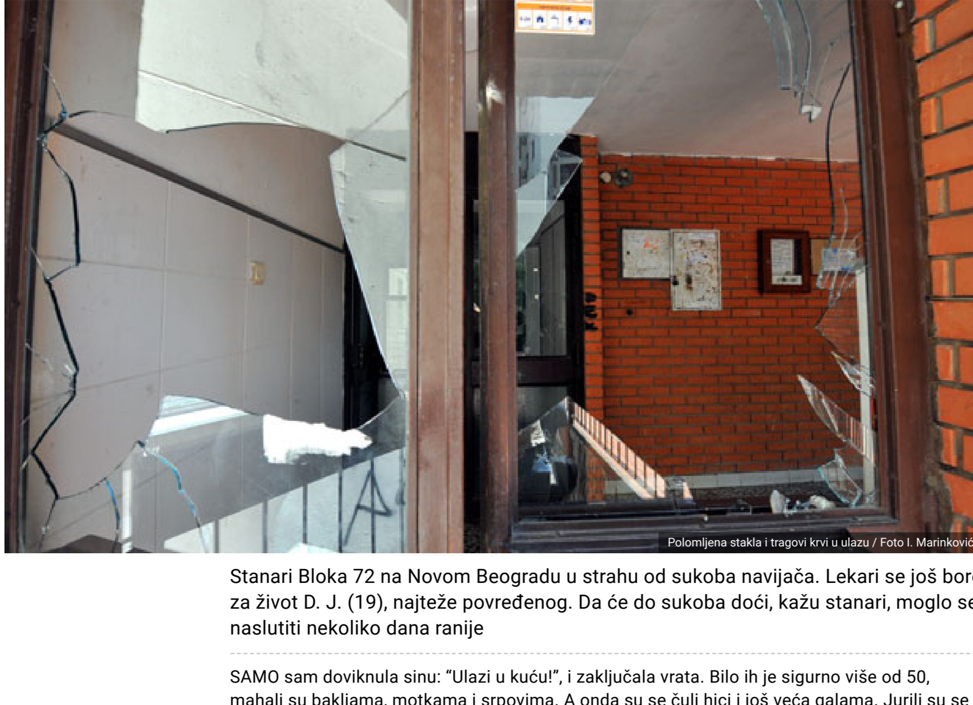
Stanari Bloka 72 na Novom Beogradu u strahu od sukoba navijača. Lekari se još bore za život D. J. (19), najteže povređenog. Da će do sukoba doći, kako stanari, mogli se naslutiti nekoliko dana ranije

Krv među navijačima pala zbog grfita D. N. 01.10.2017. 12:04h