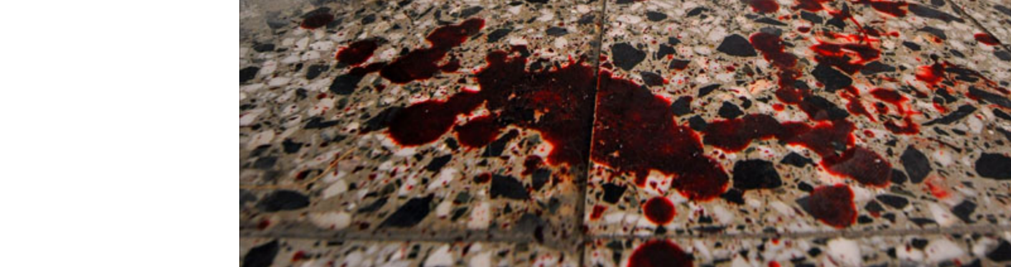
OBRAČUN KOD HRAMA

- Video sam kako nose nepomično telo i spuštaju ga na klupu - priča starija susedne zgrade. - Ostali udesnici tuče odmah su se razbežali, samo su trojica ostala sa povredjenim momkom. Ubrzo su stigli i policija i Hitna pomoć i otpremili ga na nosilima.