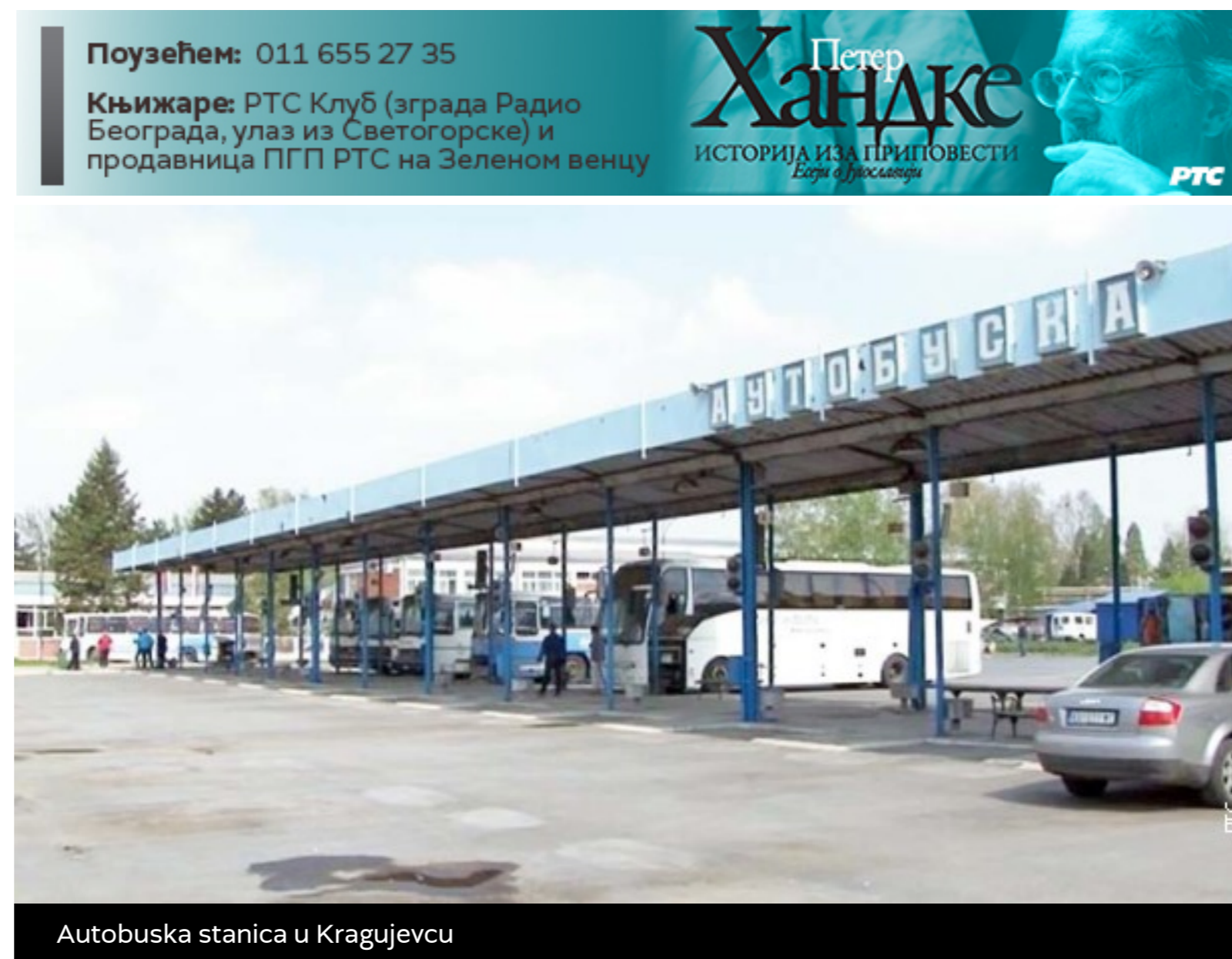
Autobuska stanica u Kragujevcu

Kako RTS saznaje, ručna bomba ubačena kroz izlog nije eksplodirala.