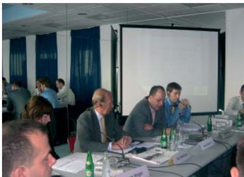
Radionica o zakonima o 'Privatnim preduzećima za poslove obezbjeđenja' u BiH, 29. Jun 2005.

i dobrovoljnih smjernica kako bi se u ovom sektoru održali maksimalno visoki standardi. U leto 2006, uz finansijsku i tehničku podršku SEESAC-a, Saferworld i Centar za sigurnosne studije (Bosna i Hercegovina) započeli su 'Sarajevski proces' u kojem su se svi akteri (bosansko-hercegovačke vlasti, grupe klijenata i međunarodne organizacije) sastali u ove svrhe. Kao prvi korak u dužem procesu poboljšanja standarda ove industrije širom jugoistočne Evrope, na okruglom stolu u Sarajevu 29. juna 2006. razmotrena su i pregledana dva dokumenta (nacrt pravila ponašanja za članove ove industrije i uputstvo koje usmjerava rad klijenata). Nakon iscrpnih revizija tokom konsultacija koje su trajale mesec dana, usvojena su Sarajevska pravila ponašanja i Uputstvo za angažovanje preduzeća koje se bavi poslovima obezbjeđenja , i ozvaničeni u septembru 2006.