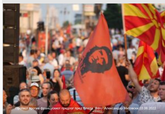
ФОТО НА ДЕНОТ

Че Гевара, во секој случај, укрне време, за да изразне во мит. Мит кој до ден денес не се предава. Иако се отргнува на луѓето од рацете, ги збунува коментарите, истражувањето и науката, и повторно полетува преку Андите, како би можеле луѓето да го бараат и среќаваат во далечните градови во Боливија, во канџите на небесите Кордильери, кои го натприкуваат ланецот на латиноамерикански земји помеѓу Пацификот и Атлантскиот. Сигурно е дека Ернесто Гевара е убиен во Боливија. Но уште по сигурно е дека Че останува и понатаму да живее. На вечно жешкото кубинско сонце, легендата за Че и понатаму живее.