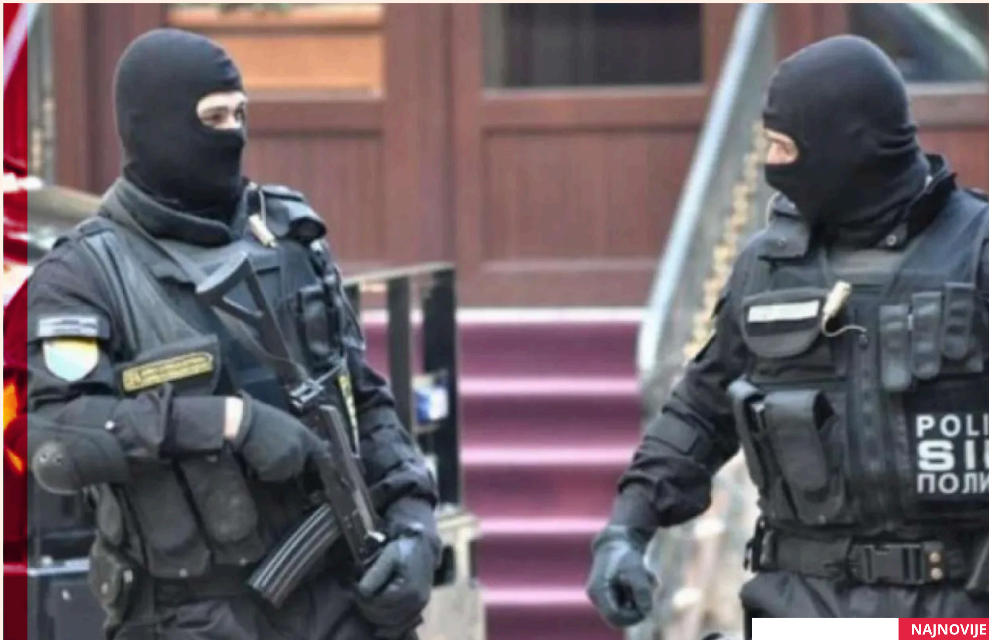
SIPA izuzima dokumentaciju iz privatnih univerziteta na području Mostara