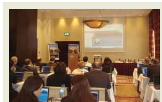
Slika 5. Predstavljanje PUK-a industriji

Tijekom narednog perioda biti će organizirane regionalne radionice kako bi se tvrtkama iz ostalih regija Hrvatske omogućilo upoznavanje s Programom unutarnje kontrole i podigla svijest o kontroli izvoza, radi sprječavanja međunarodnog terorizma i širenja oružja za masovno uništavanje.